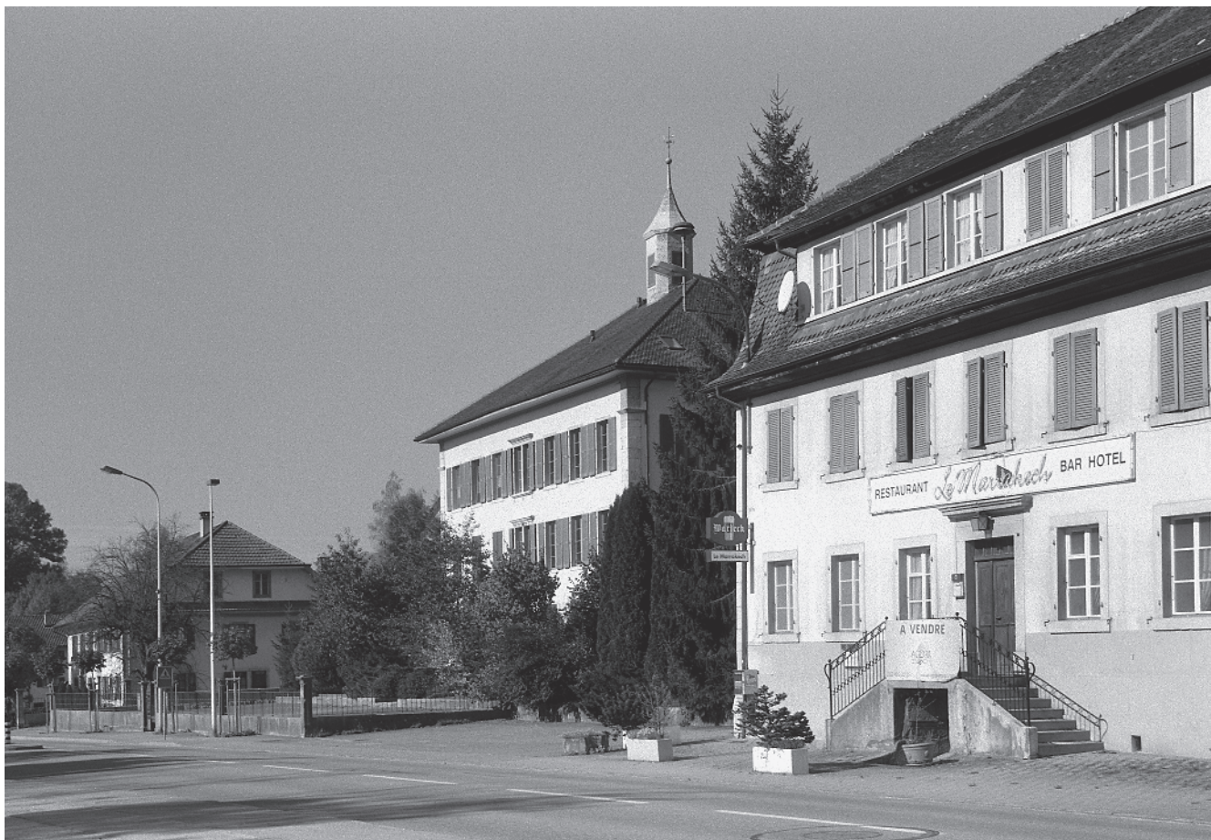
15 Grand-Rue, école de 1873