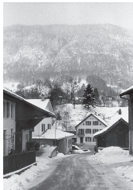
12 Chemin du Corps-de-Garde