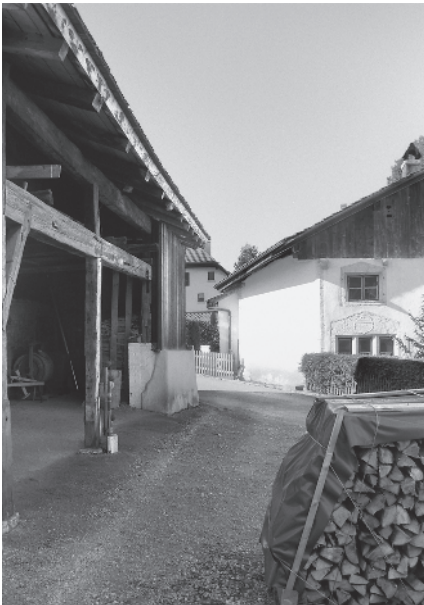
4 Maisons du Banneret/de la Dîme

Direction des prises de vue 1:10 000 Photographie 1998: 13 Photographies 2005: 1-7, 14-16 Photographies 2006: 8-12