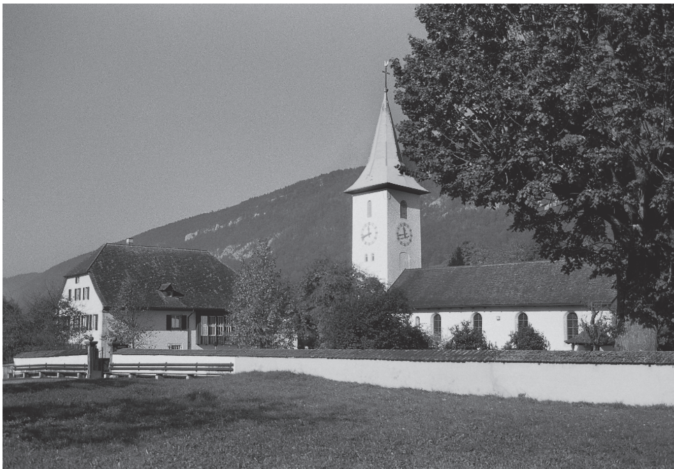
1 Eglise, cimetière et cure