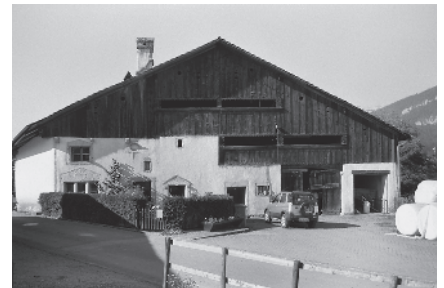
6 Maison de la Dîme