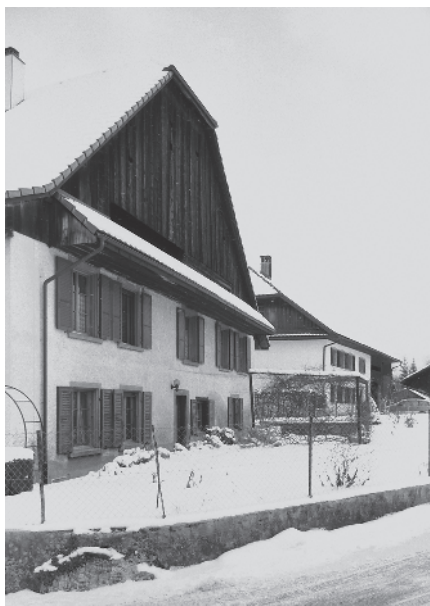
8 Rue de l'Eglise