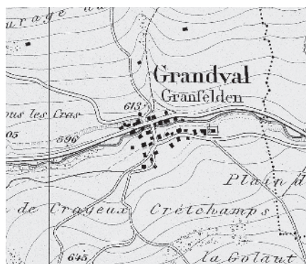
Carte Siegfried 1876

Centre ecclésiastique ancien dans le Val du Cornet près de Moutier, avec de magnifiques fermes jurassiennes du 16 e et 17 e siècle dans le noyau compact. Eglise remontant au Moyen-Age en situation de bordure typique pour la région. Axe de transit compact le long de la route cantonale.