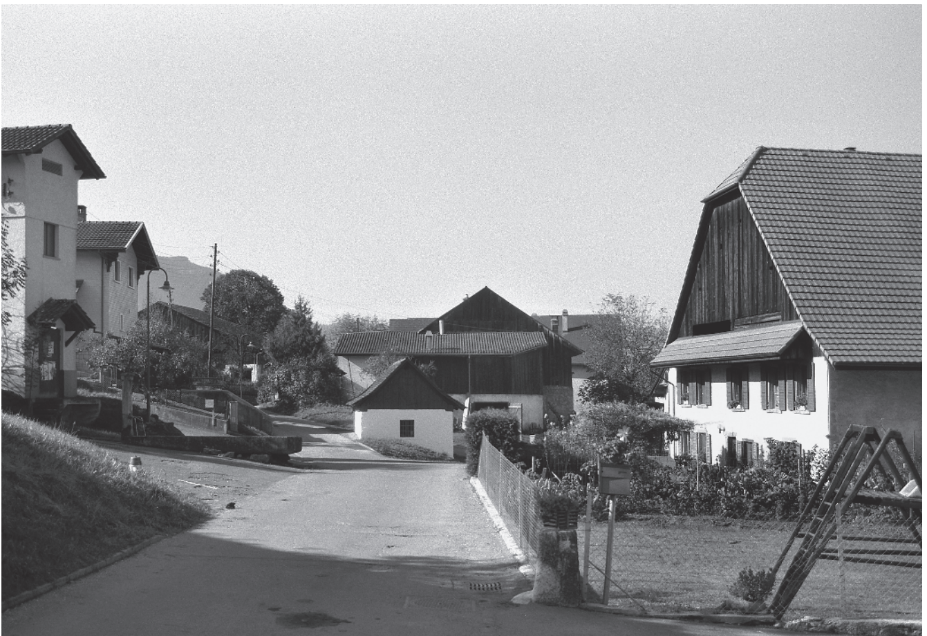
7 Bifurcation centrale, ancien corps de garde