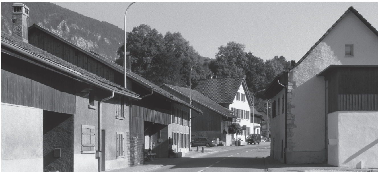
14 Grand-Rue, ancien moulin de 1750