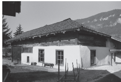
5 Maison du Banneret